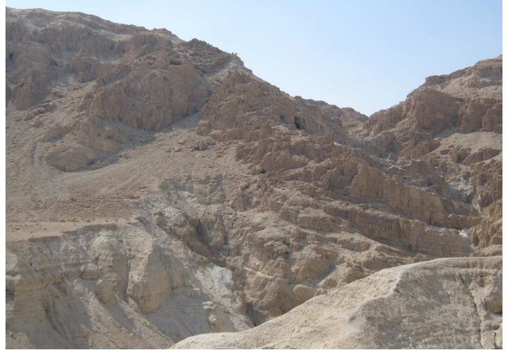
Le gole di Qumran